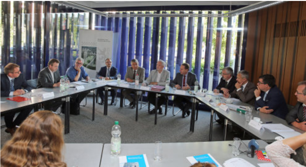
Die Bürgermeister von Gummersbach, Lindlar, Marienheide und Reichshof, der Landrat und die Deutsche Telekom stellen die Pläne der Öffentlichkeit vor. Link auf Original-Bild