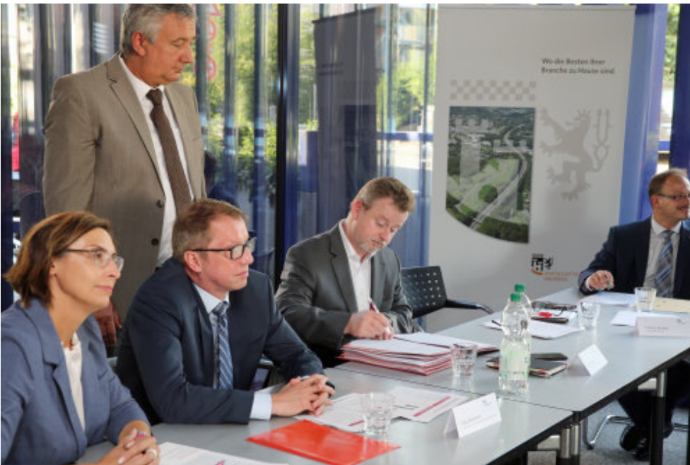
Glückliche Gesichter bei der offiziellen Vertragsunterzeichnung. Link auf Original-Bild