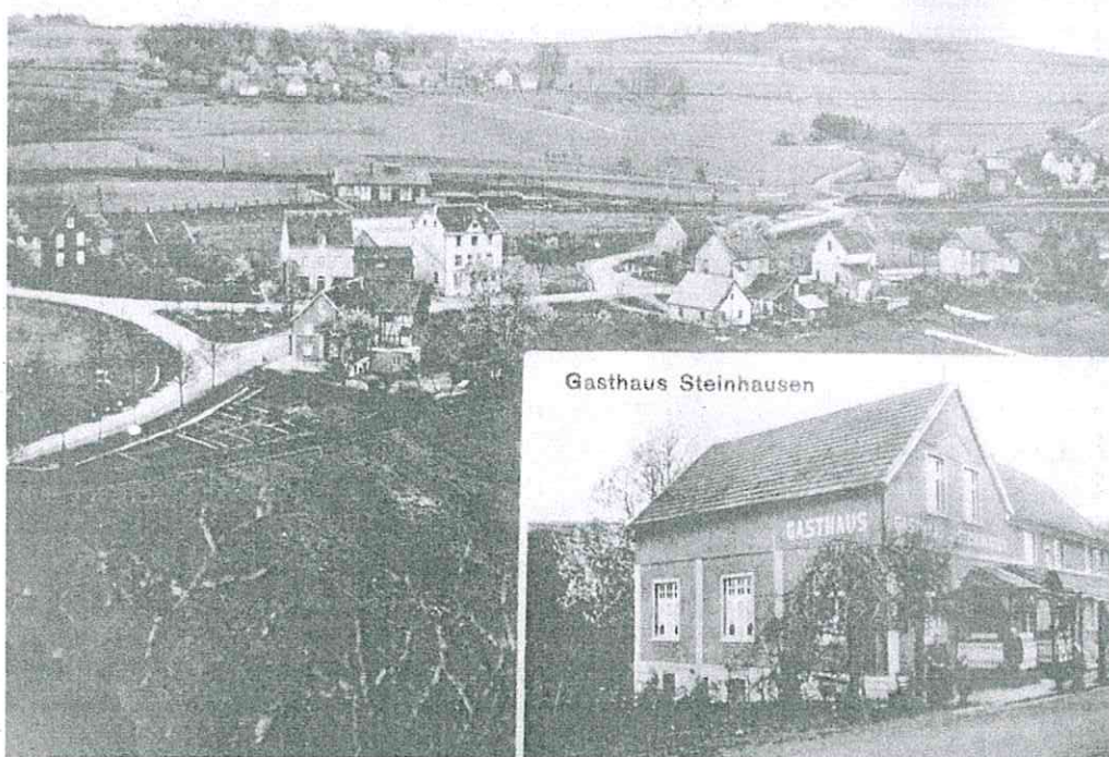
Historische Postkarte des Gasthofes Steinhausen in Brüchermühle.