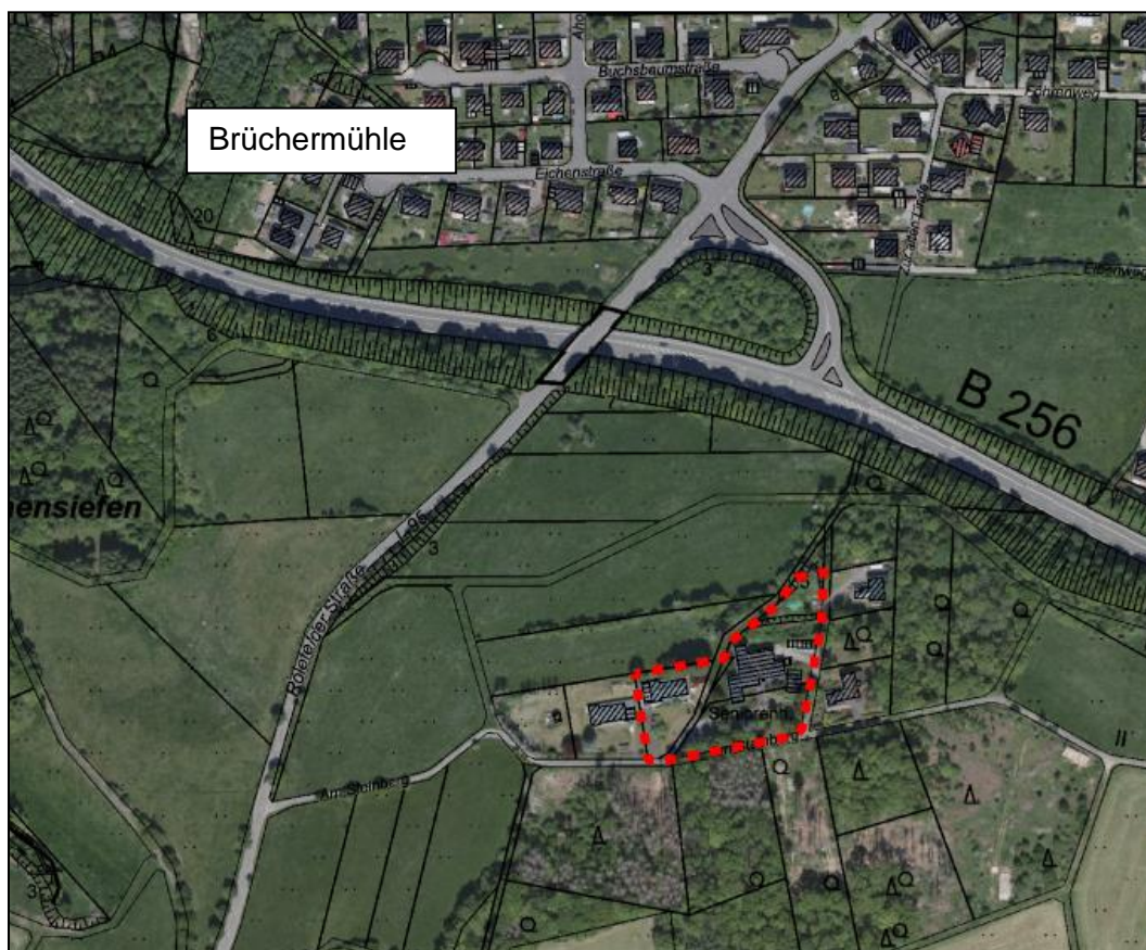
Abb. 1: Lage des FNP-Änderungsbereiches, o.M.