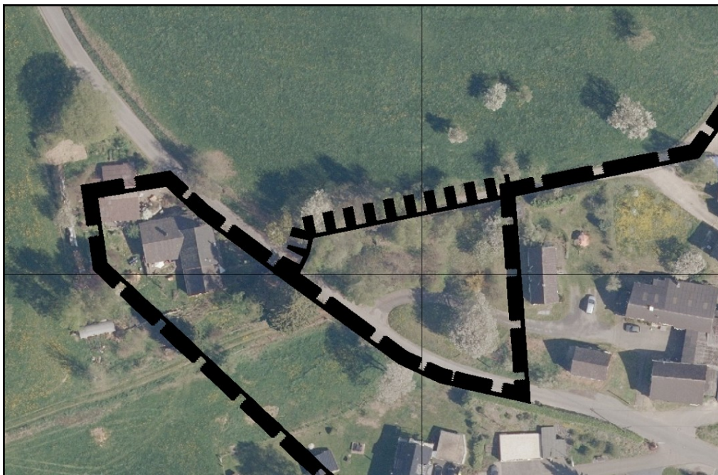
Luftbild, ohne Maßstab